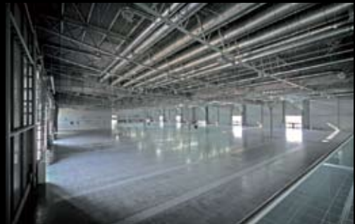
AVRIOPOINT Administrativní budova, Brno