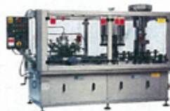
vystřikovací, plnicí a zátkovací triblok

pondělí-čtvrtek 8:30 - 17:30 pátek 8:30 - 16:30 sobota 9.00 - 12,00